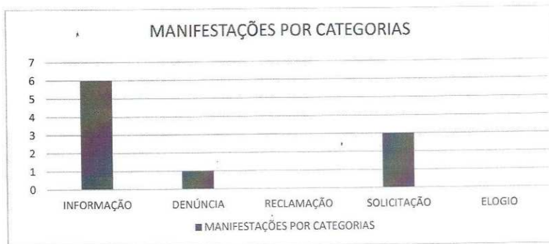
Gráfico 03 – Números de cada tipo de manifestação

Observa-se no gráfico abaixo que as manifestações mais recorrentes registradas no período foram as Informações totalizando 16 (dezesesseis) manifestações.