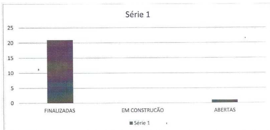
Gráfico 04 – Números de soluções de demandas

As demandas do período abertas, em constatação e/ou finalizadas são representadas pelo gráfico abaixo: