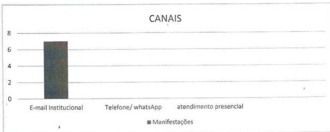
Gráfico 02 – Números de atendimentos por meio de contato